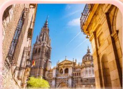
มหาวิหารแห่งโกเอลเด

ซาคราเดาที่ว้ายิ่งใหญ่ ยังไม่ทำใจ...ก็ให้เธอไปหมดแล้ว