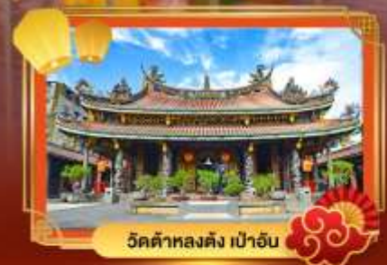
วัดต้าหลงตั้ง เป่าอัน