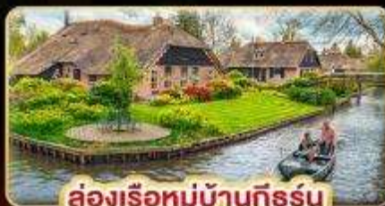
ล่องเรือหมู่บ้านกังหัน