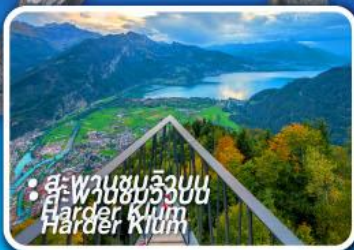
• สะพานชมวิวยอด Harder Klamm