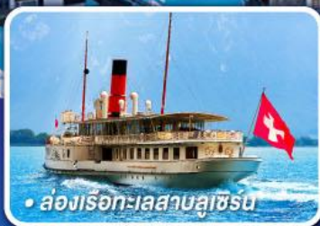
• ล่องเรือทะเลสาบลูซิร์น