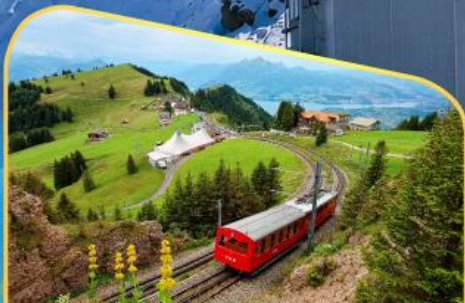
นั่งรถไฟขึ้นสู่ยอดเขาโรทิก