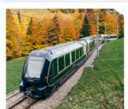
รถไฟโกลด์นพาส