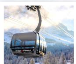
ขึ้นกระเช้ายอดเขาจุงเฟรา