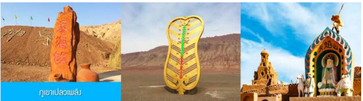
ภูเขาเปลวเพลิง

เช้า รับประทานอาหารเช้า ณ ห้องอาหารของโรงแรม (4)