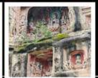
หินแกะสลักหนานคาน

PERIOD 1 : 13 - 17 ต.ค. 2569 PERIOD 2 : 17 - 21 ต.ค. 2569