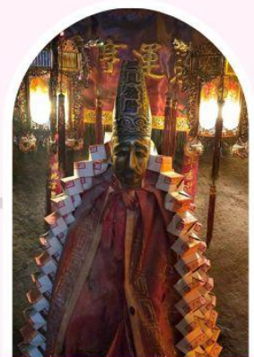
วัดหลินฟ้า โชคลาภและความมั่งคั่ง