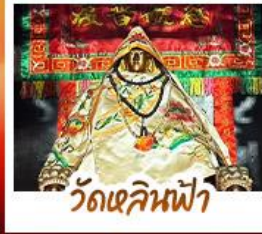
วัดเสกนพัว