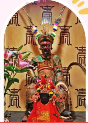
วัดเซ่งจ้งเก้งเก่าแก่ 400 ปี ไซกง