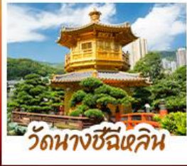
วัดนางซีฉีเสกน