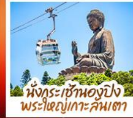
นั่งกระเช้าองปิง พระใหญ่เกาะคัมต่า