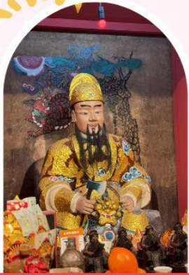
วัดเซ่งจ้งเก้งเก่าแก่ 600 ปี หยุนหลง

"ไหว้พระ เสริมดวง เพิ่มสิริมงคลแก่ชีวิต"