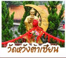
วัดเข่งงำต่าเซ็กน

ขอพรเซกครบทั้ง 3 องค์ เรื่องโชคลาภ การเงินและธุรกิจ • มังกรเซกอันองปิง ลักการะพระใหญ่เทียนถาน • เจ้าแม่กวนอิมฮ่องฮ่า ขอเรื่องเงิน ทรัพย์สิน ความมั่งคั่งเจ้าแม่กวนอิมริมทะเล ขอพรเรื่องความสำเร็จ โชคดีเปิดเป่าสิ่งไม่ดี พิธีโถงธรม 4 ดาว แหล่งฮ้อปิ่ง...ย่านจิมซาจุ่ยหรือฮ่าแมงกิก