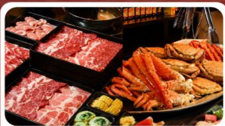
บุฟเฟต์ชาบู ขาปู 3 ชนิด