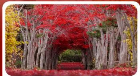
สวนลับชิราอิเกะ