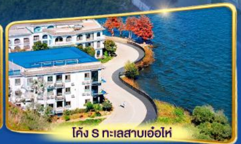
โค้ง S ทะเลสาบเอ่อไห่