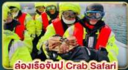
ล่องเรือจับปู Crab Safari

เดินทาง: 08-16 ต.ค. | 07-15 พ.ย. 30 พ.ย. - 08 ธ.ค. 69