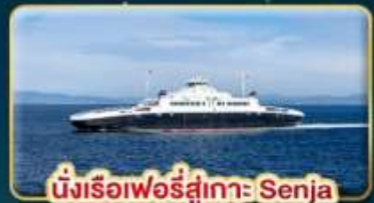
นั่งเรือเฟอร์รี่สู่เกาะ Senja