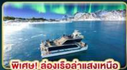
พิเศษ! ล่องเรือล่าแสงเหนือ