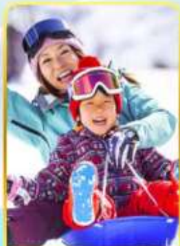
กิจกรรมลานสกีฟูจิ