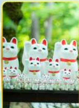
วัดโกโตคุจิ(วัดแมว)