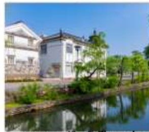
เขตอนุรักษณ์เมืองเก่า คุราชิกิ