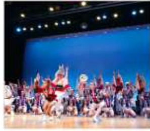
อะวะโอะโตะริไคดัง