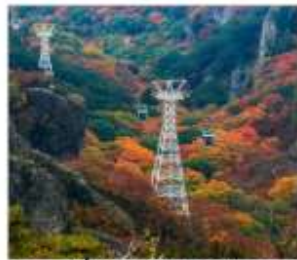
นั่งกระเช้าชมภูเขา ดังดาเดอิ