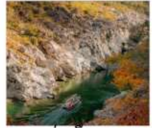
ล่องเรือชม หุบเขาโอบิโนเคะ