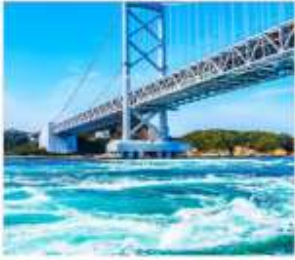
ช่องแคมนารุโตะ