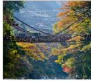
ชมสะพานคะซึระมาชิ