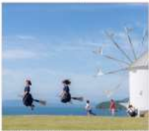
Shodoshima Olive Park เกาะมะกอก