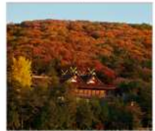
ศาลเจ้าคิโนะชิอิโกะ