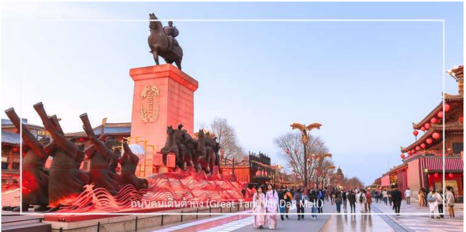
ถนนคนเดินต้าถิง (Great Tang All Day Mall)

เดินทางสู่ ถนนคนเดินต้าถิง (Great Tang All Day Mall) อีกหนึ่งแลนด์มาร์คสุดฮิตของเมืองซีอาน ตั้งอยู่ใกล้กับเจดีย์ห่านป่าใหญ่ อลังการด้วยการออกแบบที่จำลองบรรยากาศความรุ่งเรืองในยุคราชวงศ์ถัง สองฟากถนนเรียงรายด้วยอาคารสไตล์จีนประยุกต์ ผสมผสานกลิ่นอายโบราณเข้ากับความร่วมมือได้อย่างลงตัว เต็มอิมกับการเลือกชมและเลือกซื้อสินค้า ในร้านค้าของที่ระลึก คาเฟ่ ร้านอาหาร และเครื่องดื่มชื่อดัง พร้อมชม การแสดงศิลปะพื้นบ้านกลางแจ้ง ไม่ว่าจะเป็นดนตรีสด การแสดงหุ่นเงา การรำโบราณ รวมถึงการแสดงแสง สี เสียง ตามจุดต่าง ๆ ตลอดแนวถนน สำหรับผู้ที่ชื่นชอบของสะสมและฟิกเกอร์ชื่อดัง ไม่ควรพลาดการแวะชม Pop Mart ที่ตั้งอยู่ในห้างใหญ่ตรงข้ามถนนคนเดิน ภายในมีคอลเลกชันฟิกเกอร์หลากหลายแบบให้เลือกสะสม ท่ามกลางการตกแต่งที่ทันสมัยและเป็นเอกลักษณ์ ถนนสายนี้จึงเปรียบเสมือนการเดินทางข้ามกาลเวลา สัมผัสทั้งวัฒนธรรมดั้งเดิมและเทรนด์ร่วมสมัยได้ในที่เดียวกัน