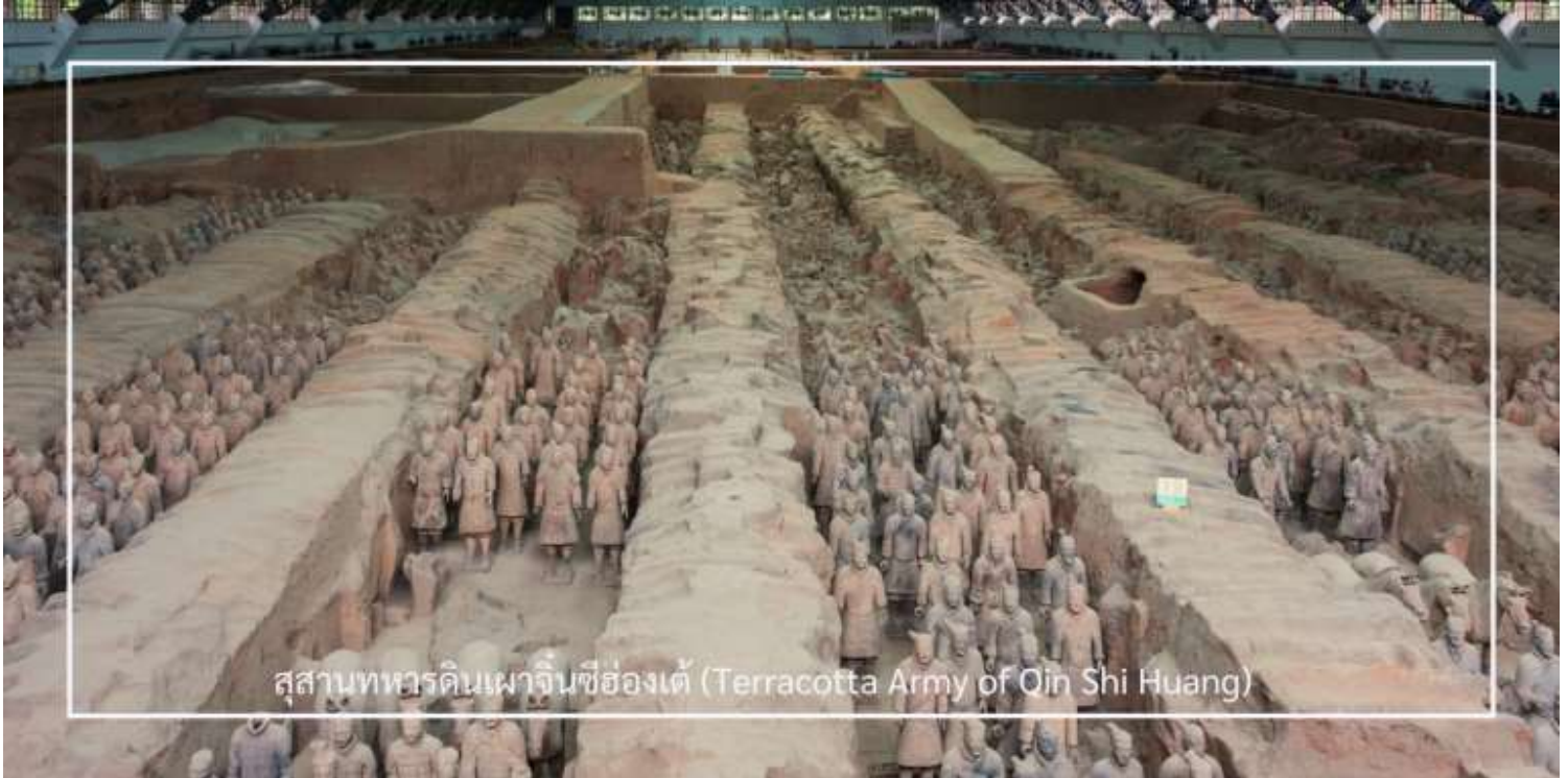
สุสานทหารดินเผาจีนซีฮ่องเต้ (Terracotta Army of Qin Shi Huang)

นำท่านเดินทางสู่ สุสานทหารดินเผาจีนซีฮ่องเต้ (Terracotta Army of Qin Shi Huang) หนึ่งในสิ่งมหัศจรรย์ของโลก ยุคโบราณและแหล่งโบราณคดีที่สำคัญที่สุดของจีน ตั้งอยู่ใกล้เมืองซีอาน มณฑลส่านซี ค้นพบโดยบังเอิญในปี ค.ศ. 1974 ก่อนจะได้รับการขึ้นทะเบียนเป็นมรดกโลกโดยยูเนสโกในปี ค.ศ. 1987 สุสานแห่งนี้คือสถานที่ฝังพระศพของ “ จีนซีฮ่องเต้ ” จักรพรรดิองค์แรกของจีนผู้รวบรวมแผ่นดินเป็นหนึ่งเดียวในยุคราชวงศ์ฉิน ครอบคลุมพื้นที่หลายหมื่นตาราง เมตร แบ่งเป็น 3 หลุม ซึ่งภายในมีทหารดินเผากว่า 8,000 ตัว ที่ถูกสร้างขึ้นอย่างประณีต มีใบหน้า ท่าทาง และเครื่องแต่งกายแตกต่างกันไป พร้อมด้วยรถศึก ม้า และอาวุธโบราณ ที่วางเรียงรายอย่างเป็นระเบียบในหลุมฝังศพ เพื่อปกป้อง จักรพรรดิในชีวิตหลังความตาย