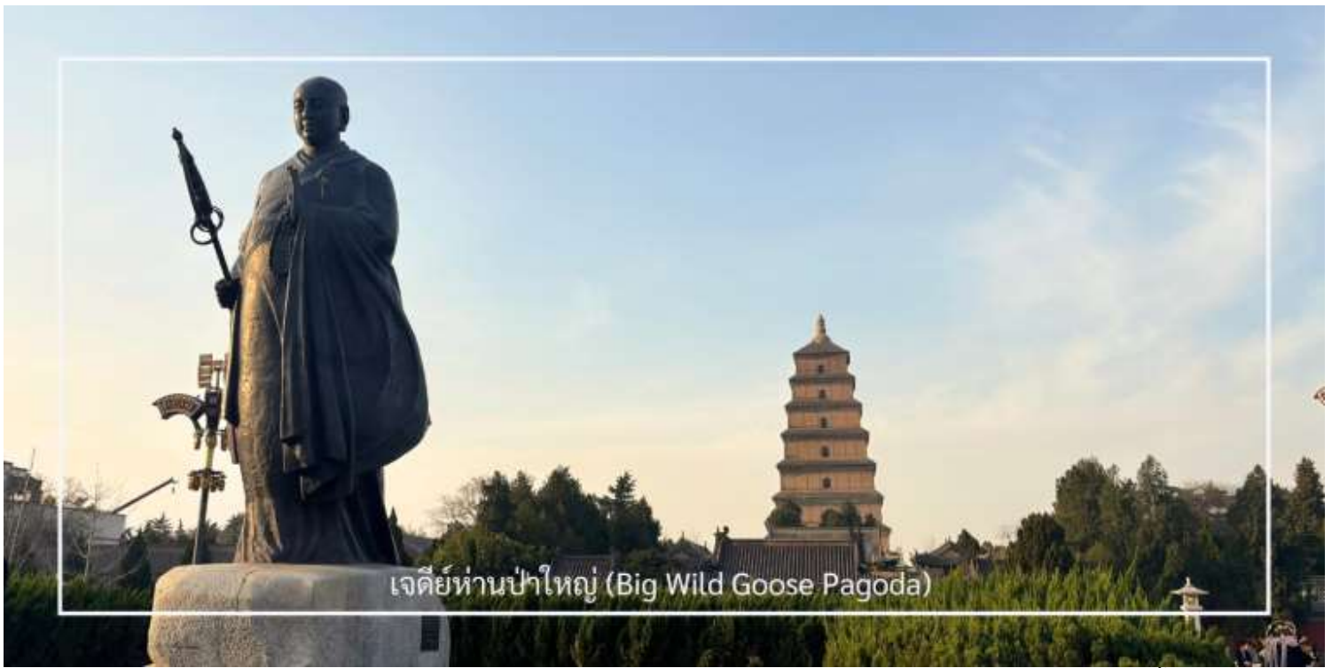
เจดีย์ห่านป่าใหญ่ (Big Wild Goose Pagoda)

เดินทางสู่ ถนนคนเดินต้าถิง (Great Tang All Day Mall) อีกหนึ่งแลนด์มาร์คสุดฮิตของเมืองซีอาน ตั้งอยู่ใกล้กับเจดีย์ห่านป่าใหญ่ อลังการด้วยการออกแบบที่จำลองบรรยากาศความรุ่งเรืองในยุคราชวงศ์ถัง สองฟากถนนเรียงรายด้วยอาคารสไตล์จีนประยุกต์ ผสมผสานกลิ่นอายโบราณเข้ากับความร่วมมือได้อย่างลงตัว เต็มอิมกับการเลือกชมและเลือกซื้อสินค้า ในร้านค้าของที่ระลึก คาเฟ่ ร้านอาหาร และเครื่องดื่มชื่อดัง พร้อมชม การแสดงศิลปะพื้นบ้านกลางแจ้ง ไม่ว่าจะเป็นดนตรีสด การแสดงหุ่นเงา การรำโบราณ รวมถึงการแสดงแสง สี เสียง ตามจุดต่าง ๆ ตลอดแนวถนน สำหรับผู้ที่ชื่นชอบของสะสมและฟิกเกอร์ชื่อดัง ไม่ควรพลาดการแวะชม Pop Mart ที่ตั้งอยู่ในห้างใหญ่ตรงข้ามถนนคนเดิน ภายในมีคอลเลกชันฟิกเกอร์หลากหลายแบบให้เลือกสะสม ท่ามกลางการตกแต่งที่ทันสมัยและเป็นเอกลักษณ์ ถนนสายนี้จึงเปรียบเสมือนการเดินทางข้ามกาลเวลา สัมผัสทั้งวัฒนธรรมดั้งเดิมและเทรนด์ร่วมสมัยได้ในที่เดียวกัน