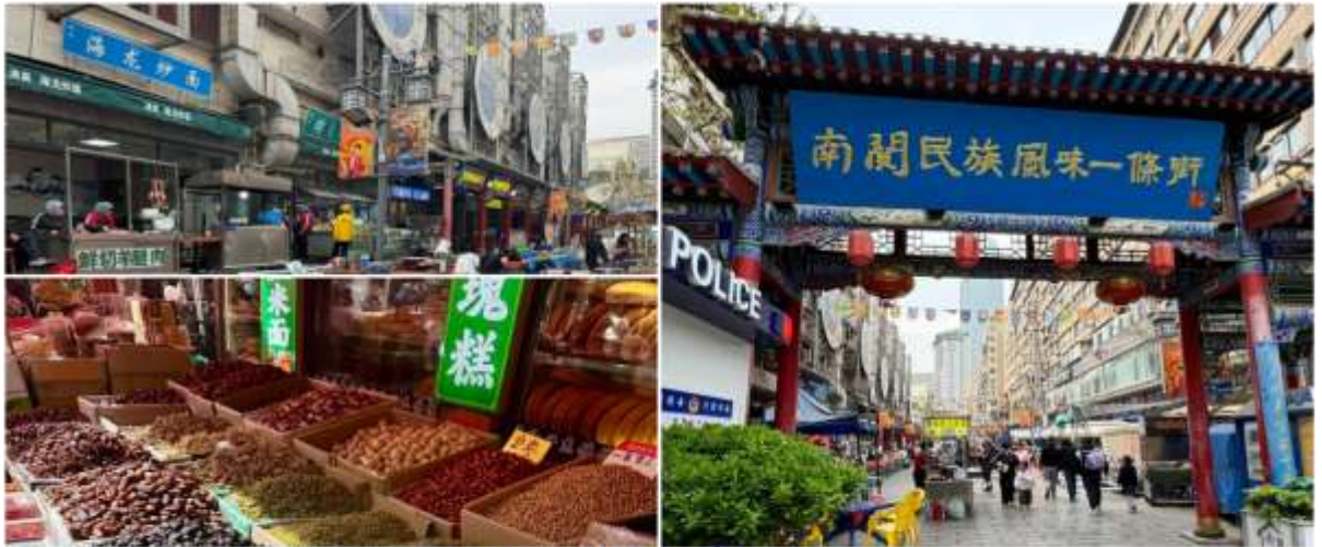
ถนนคนเดินเซี่ยหนานกวน

สมควรแก่เวลานำทุกท่านเดินทางสู่สนามบิน เพื่อทำการเช็คอินกับสายการบิน