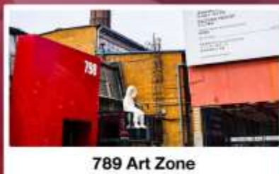
798 Art Zone