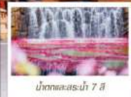
น้ำตกทะเลสาบไห่ 7 สี

🗋️ โหลด 23 KG. x1 ทั้งไป - กลับ ✓ ฟรีนียบตัว ✓ ไม่เข้าร้านรัฐบาล ✓ ทิวทัศน์แปลก ✓ รวมค่าเข้าชมสถานที่ตามโปรแกรม