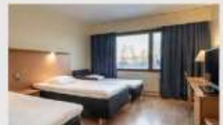
Triple สำหรับ 3 ท่าน