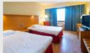
Twin สำหรับ 2 ท่าน