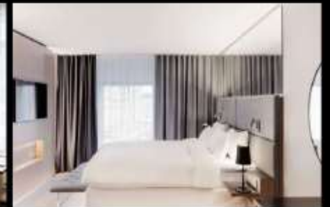
***รูปภาพเพื่อประกอบการโฆษณาเท่านั้น***