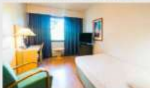
Single สำหรับ 1 ท่าน