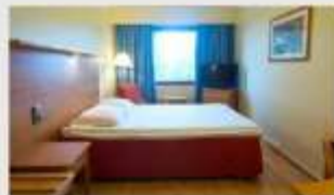
Double สำหรับ 2 ท่าน