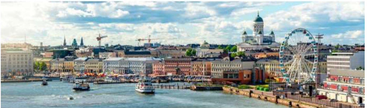
RADISSON BLU ROYAL HOTEL HELSINKI