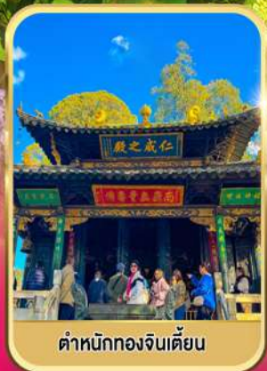
ตำหนักทองจีนเตียน