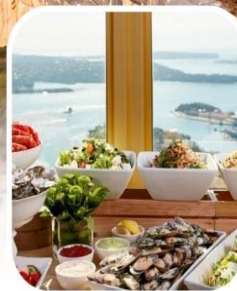
SKYFEAST BUFFET SYDNEY TOWER