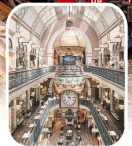
QUEEN VICTORIA BUILDING