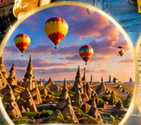
เมืองคัปปาโดเกีย Cappadocia