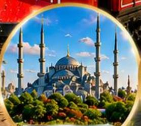
สุเหร่าสีน้ำเงิน Blue Mosque