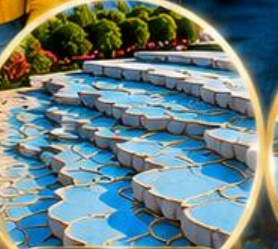
ปานุกคาล์ Pamukkale