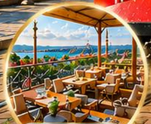
Seven Hills Cafe ชมวิว อิสตันบูล