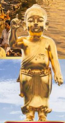
องค์พระพุทธรูปเจ้าน้อย