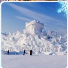
งานแกะสลัก เกาะพระอาทิตย์