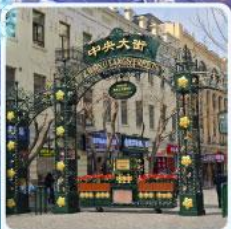
ถนนจงยาง