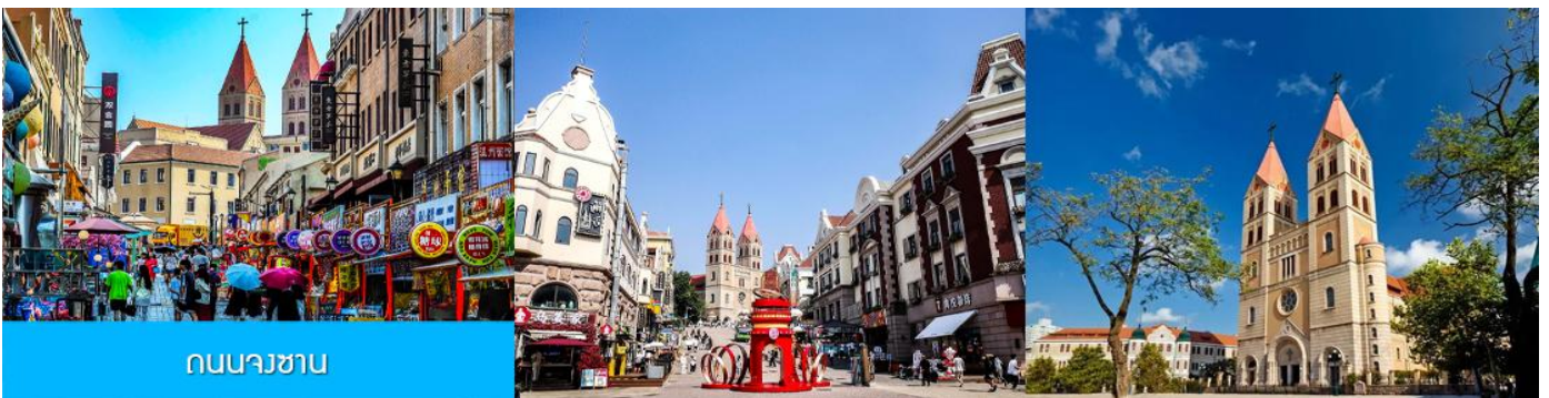
ถนนจงซาน