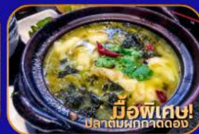
มีอพิเศษ! ปลาต้มผักกาดดอง