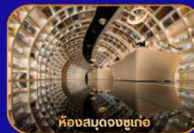
ห้องสมุดจงซูเกอ