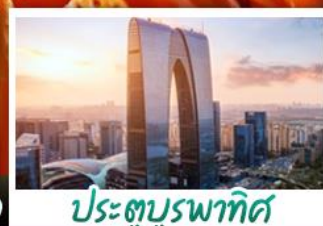
ประตูบูรพาทิศ