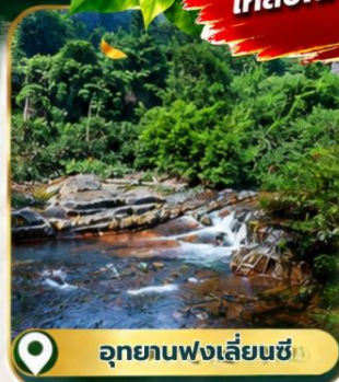
อุทยานฟ่งเลี่ยนซี