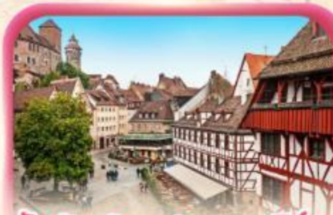
สัมผัสเมืองเก่าบูเรมเบิร์ก