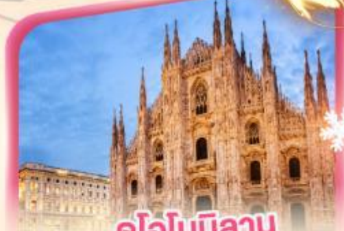
คูโอโมมิลาโน