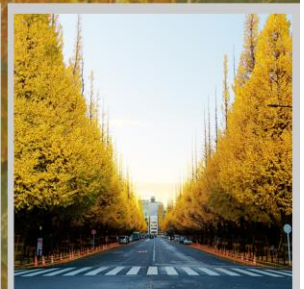
"ICHONAMIKI GINGO AVENUE"