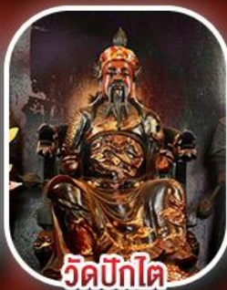
วัดป้าโต