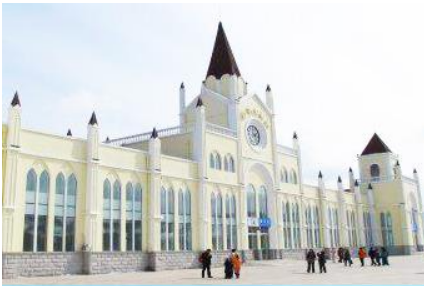
สถานีรถไฟยาบูลิ

หมายเหตุ เพื่อความสะดวกในการเข้าพักใน HOME STAY ภายในหมู่บ้านหิมะ ทางทัวร์แนะนำให้ท่านจัดเตรียมเสื้อผ้าและเครื่องใช้เท่าที่จำเป็น 1 ชุดใส่กระเป๋าใบเล็กหรือเป้แบบสะพายได้ เพื่อสะดวกในการนำติดตัวไปใช้สำหรับคืนที่นอนในหมู่บ้านหิมะ หากนำกระเป๋าเดินทางใบใหญ่เข้าสู่ที่พักในหมู่บ้านอาจสร้างความไม่สะดวกแก่ท่าน จึงไม่แนะนำ