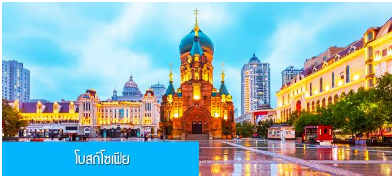
โบสถ์โซเฟีย