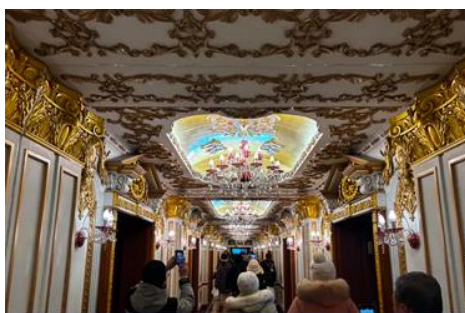
ตึกเภสัชกรรมฮาร์บิน

จากนั้นนำท่านเที่ยวชม ถนนจงย้ง 中央大街 ถนนสายหลักของเมืองฮาร์บิน ถนนที่เต็มไปด้วยอาคารบ้านเรือนที่เป็นสถาปัตยกรรมตะวันตกที่สร้างในช่วงคริสต์ศตวรรษที่ 18 – 19 ที่เมืองนี้ถูกปกครองโดยรัสเซีย อีกทั้งเป็นถนนคนเดินที่เป็นแหล่งรวมร้านค้าสินค้าแบรนด์เนมทั้งในและต่างประเทศ ร้านจำหน่ายของที่ระลึกและสินค้าพื้นเมือง ร้านอาหารพื้นเมืองต่าง ๆ มากมาย ให้ท่านมีเวลาอิสระเดินเที่ยวและช้อปปิ้ง หรือลิ้มรสอาหารพื้นเมืองตามอัธยาศัย.. **ให้ท่านลิ้มรสไอศกรีมชื่อดังเก่าแก่ของเมืองฮาร์บินท่านละ 1 ท่านฟรี