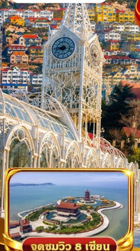
จุดชมวิว 8 เซียน