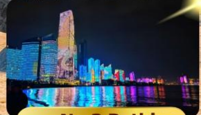
หาด No.3 Bathing

เมนูพิเศษ ซาบูสายพาน 6 วัน 4 คืน เดินทาง : พฤษภาคม 69