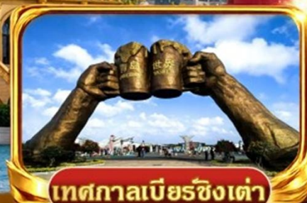
เทศกาลเบียร์ชิงเต่า