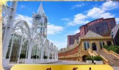
ระบียงยุโรป