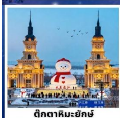
ตึกตาคิมะฮักซ์