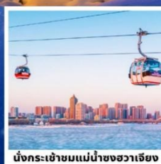
นั่งกระเช้าชมแม่น้ำขงฮวาเจียง