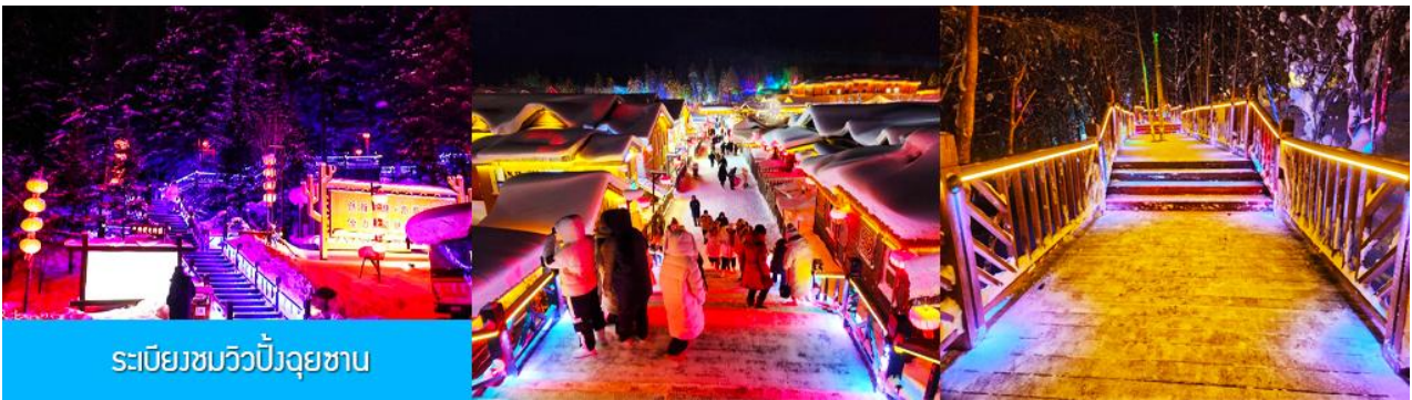
ระเบียบชมวิวยังอุยซาน