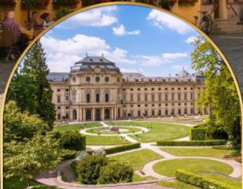
พระราชวังแวร์ซายส์ ฝรั่งเศส