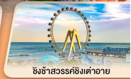
ชิงช้าสวรรค์ซิงต้าอาย