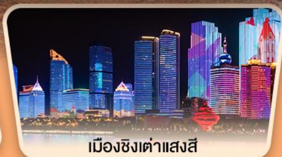
เมืองซิงต้าแสงสี