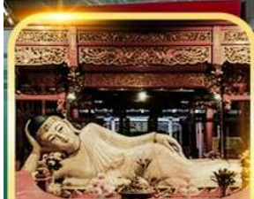
วัดพระหยกขาว