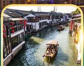
เมืองโบราณจูเจียเจี้ยว