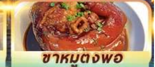
ชาหมุดงพอ