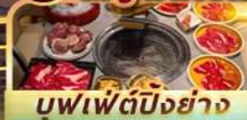
บุฟเฟ่ต์ปิ้งย่าง