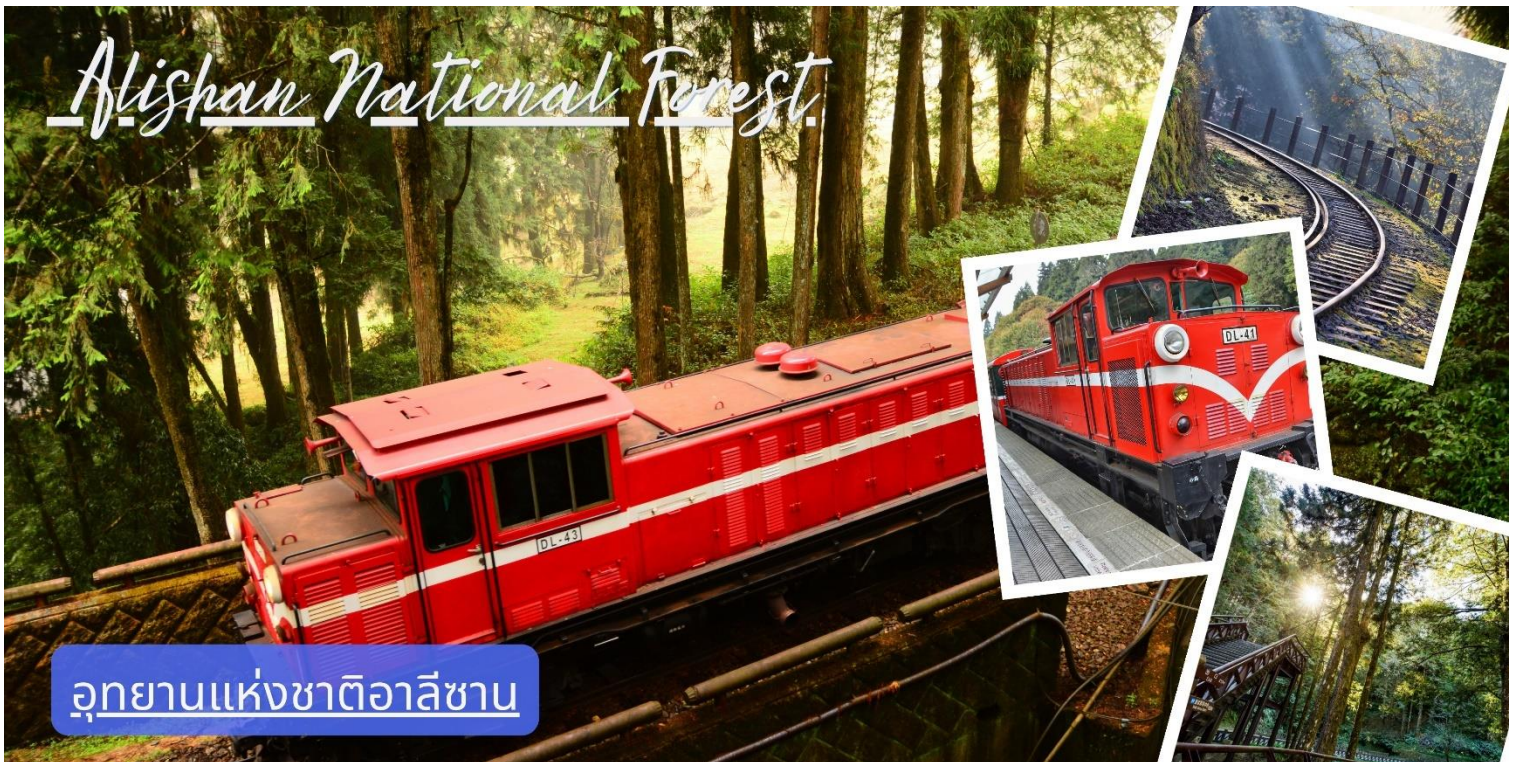
อุทยานแห่งชาติอาลีซาน

ท่านเดินทางสู่ อุทยานแห่งชาติอาลีซาน (Alishan National Forest) อุทยานที่มีชื่อเสียงที่สุดของไต้หวัน ตั้งอยู่ในเมืองเจียอี้ สัมผัสอากาศบริสุทธิ์และความเขียวขจีของป่าสนอายุพันปี เพลิดเพลินกับการเดินป่าท่ามกลางธรรมชาติอันสวยงามและเงียบสงบ นำท่าน สักการะเจ้าพ่อเสือ ณ ศาลเจ้าพ่อเสือกลางอุทยานอาลีซาน ซึ่งตั้งอยู่ท่ามกลางธรรมชาติอันร่มรื่น เชื่อกันว่าเจ้าพ่อเสือเป็นเทพผู้ปกป้องรักษา คอยปิดเป่าสิ่งชั่วร้าย และให้โชคลาภกับผู้ศรัทธา ผู้คนมักจะขอพรเรื่องความปลอดภัย การเดินทางราบรื่น การงานราบรื่น และปิดเป่าสิ่งไม่ดี จากนั้นให้ท่านได้สัมผัสประสบการณ์สุดพิเศษกับ การนั่งรถไฟโบราณสีแดง หรือ รถไฟอาลีซาน (Alishan Forest Railway) (รวมนั่งรถไฟโบราณ 1 เที่ยว) หนึ่งในเส้นทางรถไฟที่ได้รับการยกย่องว่าสวยที่สุดติดอันดับ 1 ใน 3 ของโลกเส้นทางรถไฟสายนี้โดดเด่นด้วยเอกลักษณ์เฉพาะตัว รถไฟสีแดงสดจะพาท่านวิ่งลัดเลาะผ่านผืนป่าสนและภูเขาอันอุดมสมบูรณ์ ตลอดสองข้างทาง พร้อมได้ระดับชั้นสู้อยอดเขาอย่างช้าๆ ให้ท่านได้ดื่มด่ำกับทัศนียภาพธรรมชาติที่งดงามอลังการตลอดเส้นทาง