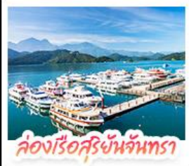
ล่องเรือสุริยันจันทร์

ล่องเรือชมทะเลสาบสุริยันจันทร์ (SUN MOON LAKE) ชมเกาะลาลู แวะวัดสวนกง • อีสระดินล่ม หมู่บ้านอิต้าซ่า • นั่งรถไฟลิกโบราณ (1 สถานี) ลิ้มรสบรรยากาศเส้นทางรถไฟสายธรรมชาติ • ตะลุย ไทจงไนท์มาร์เก็ต แหล่งรวมแฟชั่นและสตรีทฟู้ด • ช้อปปิ้งย่าน ซิเหมินดิง (XIMENDING) ถ่ายรูปแลนด์มาร์ค ดึกไทเป 101 • ช้อปปิ้งถึงทวงที่ MITSUI OUTLET PARK ชมความสวยงามของ อนุสรณ์สถานเจียงไคเช็ค • ขอพรความรักที่ วัดหลงชาน ชมโคมหิมะยราชนิชิที่ เย่หลิว • ชมบรรยากาศเมืองเก่าที่ จิวเฟิน