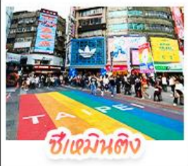
ซีเหมินดิง