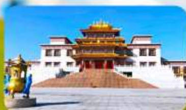
คฤหาสน์พุทธบูชาแห่งชีวิคูลาน