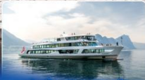
ล่องเรือทานอาหารกลางวัน ทะเลสาบลูเซิร์น