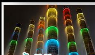
น้ำพุไม้ไผ่ตักSKP