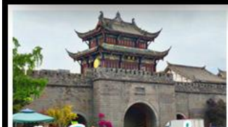
เมืองโบราณกวนเซี่ยน

ภูเขาสี่ดรุณี - อุทยานปู้ผิงโกว - สะพานหมานเฉียว - ร้านหนังสือจงซูเก้อ - เมืองโบราณกวนเสี้ยน จตุรัสหย่างเทียนหวู่ - หมีแพนด้าเซอเฟี - ถนนโบราณชอยกวางชอยแคบ - ถนนคนเดินไท่กูหลี่ ถนนคนเดินซุนซี - ถนนโบราณจินหลี่ - แพนด้ายักษ์เปิ่นตัก - น้ำพุไม้ไผ่ตักSKP - วัดต้าอ้อ