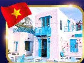
คาเฟ่สไตล์ซานโตรินี่ ชันตรา มาริน่า