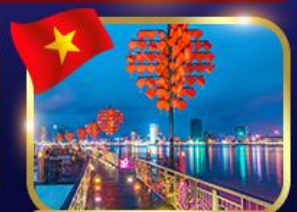
สะพานแห่งความรัก ดานัง