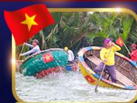
ล่องเรือกระด้ง หมู่บ้านกัมกาน