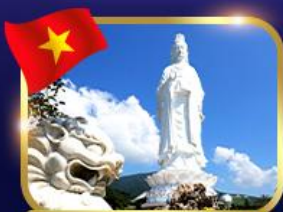
ชมพระอภิมหาอิม วัดหลินอึ้ง