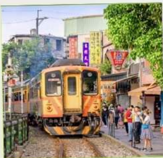
สถานีรถไฟซือเฟิ่น