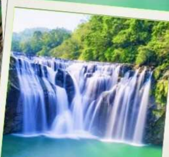
น้ำตกซือเฟิ่น