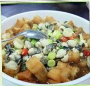
ถนนโบราณซือเฟิ่น