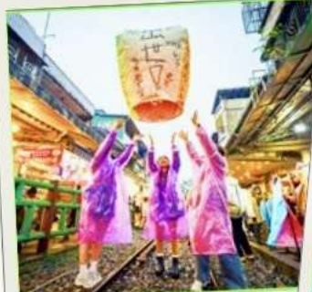
ปล่อยโคมลอย