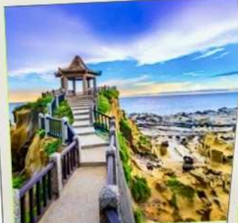
อุทยานเกาะเหอผิง