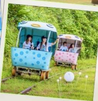
Shen'ao Rail Bike