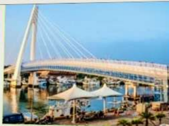
สะพานคู่รักตั้นสุ่ย