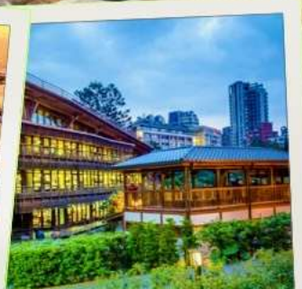
ห้องสมุดเป่ย์โถว