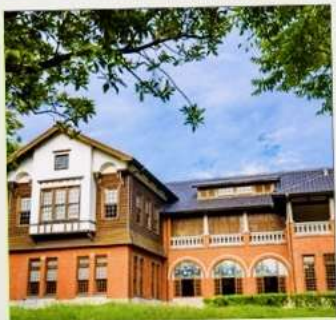
พิพิธภัณฑน์น้ำพุร้อนเป่ย์โถว