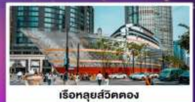
เรือหลุยส์วิคตอง