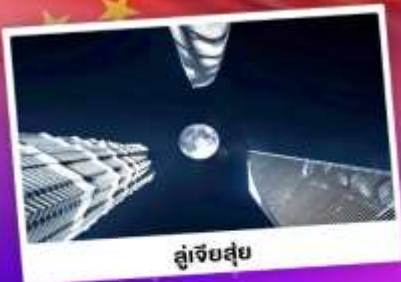
ลู่อัจฉริยะ