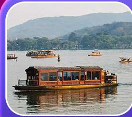
“ล่องเรือทะเลสาบซีหู”