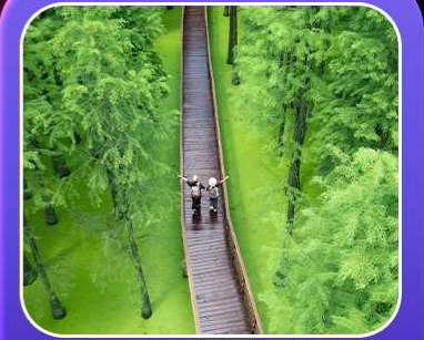
“ป่าสนชิงซาน”

T2G-HGH01GJ Welcome Hangzhou...หังโจว ฉู่โจว ฉู่หยวน ช่างเหรา หุบเขาเทวดา 5D 4N (GJ)