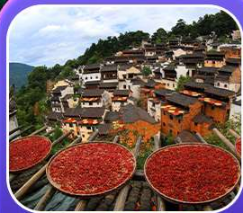
“หมู่บ้านหวงหลิง”

หุบเขาเทวดาวังเซียนกู่ หมู่บ้านที่ตั้งอยู่ริมหน้าผา • หมู่บ้านโบราณหวงหลิง ป่าสนน้ำชิงซาน • ล่องเรือทะเลสาบซีหู • ถนนโบราณตุ๋นโจ้ว • ชมแสงสีที่ ฉู่หนีโจ้ว