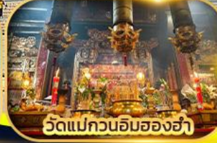
วัดแม่กวนอิมฮ่องฮ่า