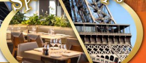
รับประทานอาหารกลางวันบนหอคอไอเฟล

ไฮไลท์ในโปรแกรม • สะพานไมซ์าเปล ลูเซิร์น