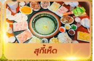
สุกี้เด็ด