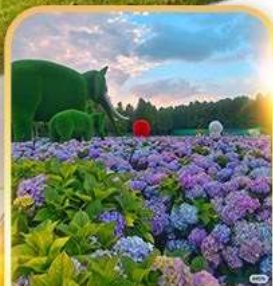
ดอกไม้ตามฤดูกาล