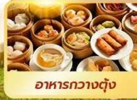
อาหารกวางตุ้ง